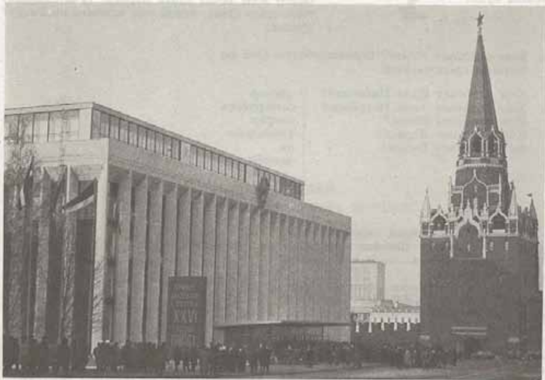
Кремлевский Дворец съездов.

— Ну, в нашем городе все молодые. И город наш молодой.