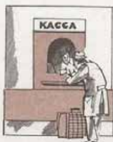
Это касса вокзала.