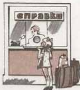
Это справочное бюро.