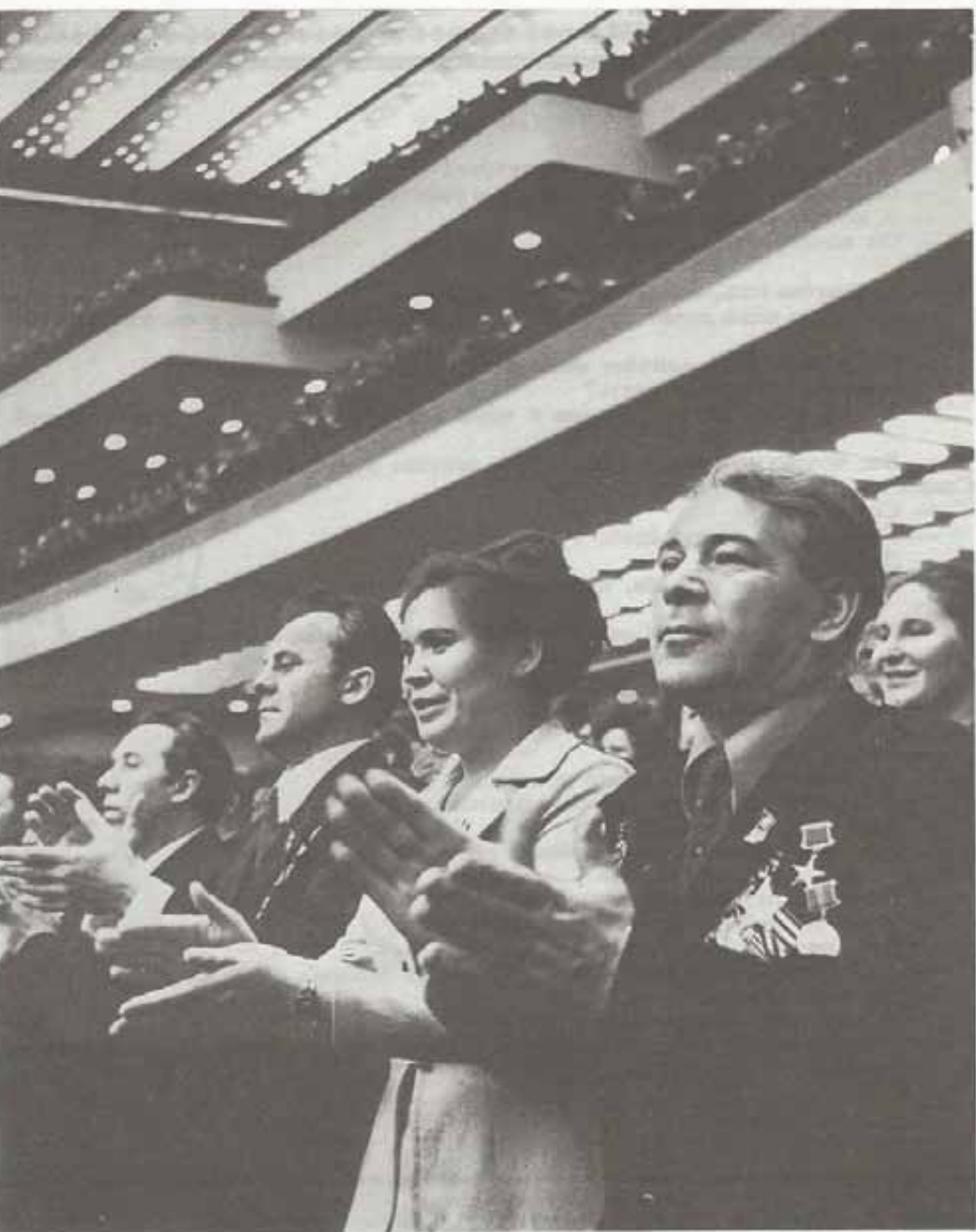
Депутаты Верховного Совета СССР.